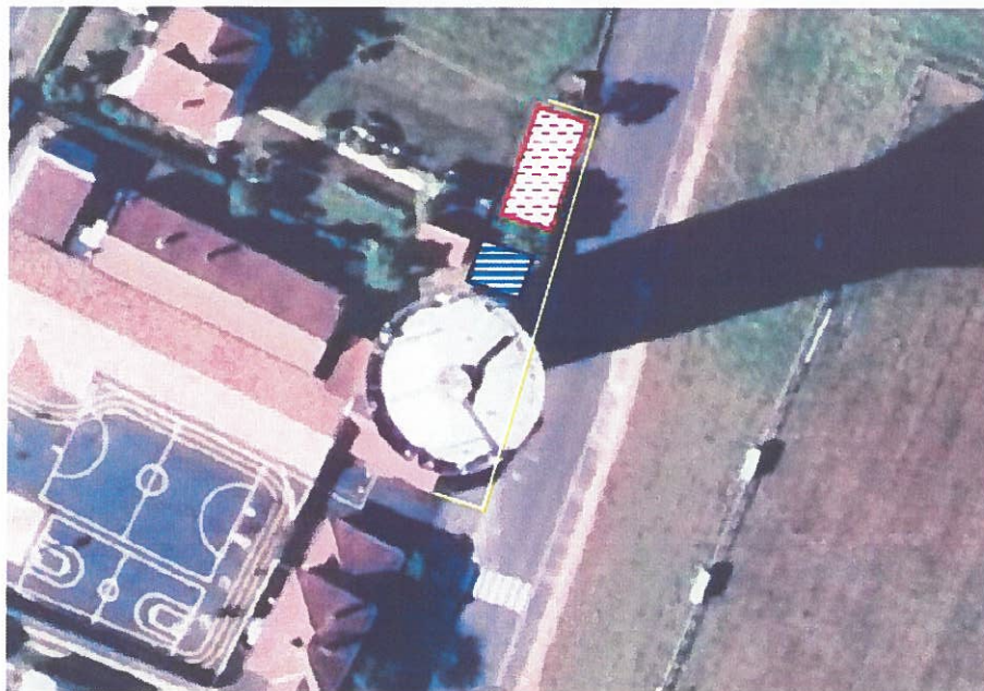
Plan d'installation de chantier